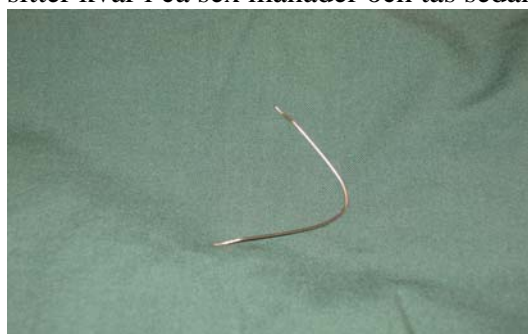
Bild: Fjädrar av härdat rostfritt stål

Hjärnan är en känslig struktur som inte tål att man håller på och formar den för snabbt. – Det innebär att vi inte kan stå och operera och omforma för mycket vid ett tillfälle. I stället har metoder med fjädrar av härdat rostfritt stål utarbetats. Dessa fjädrar som opereras in där vi vidgat skallbenet, påverkar skallformen efter patientens behov och gör sitt jobb även efter operationen. Fjädrarna har ett visst tryck som gör att de expanderar så som vi har för avsikt att de skall göra. De skapar en lokal bentillväxt och kan kompensera för defekt tillväxt på grund av för tidigt stängda tillväxtzoner. De inopererade fjädrarna sitter kvar i ca sex månader och tas sedan bort.