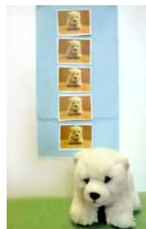
Ett bildschema kan vara ett sätt att tydliggöra planeringen för små barn.

Barnet kan rita och den vuxne kan skriva vad barnet berättar om sina bilder. Barnet kan få dekorera sin egen bok/mapp och ge den ett namn.