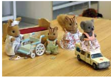
Djurfamiljer kan användas vid rollspel.

Spela upp rollspel med exempelvis djurfamiljer (läs mer under Material i barngruppen), som visar situationer som ofta uppkommer i familjer som har barn med funktionsnedsättningar. I rollspelen kan man också illustrera de olika teman man har för träffarna. Rollspelen kan exempelvis spegla hur det är att vara en annorlunda familj, vad som händer om syskonet med funktionsnedsättningar springer bort eller vad man måste tänka på när man ska resa bort.